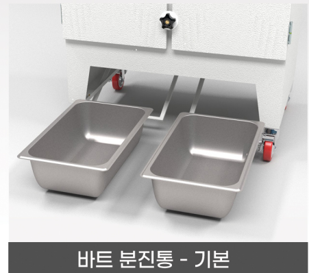
바트 분진통 - 기본