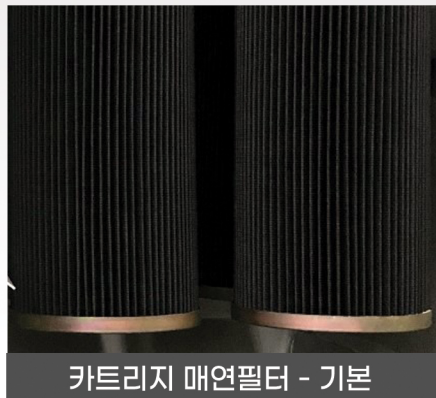
카트리지 매연필터 - 기본